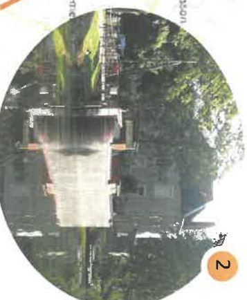
Musée du canal