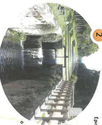
Écluse de Rouéron

Le musée du Canal de Berry retrace l'épopée étonnante des écluseurs, menuisiers et charpentiers de bateaux qui ont marqué la vie locale pendant plus d'un siècle.