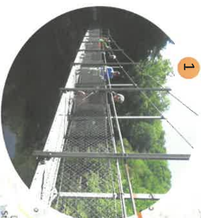
Passerelle de Lignerolles